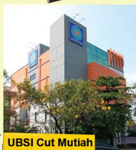
UBSI Cut Mutiah