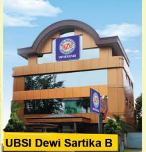
UBSI Dewi Sartika B