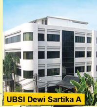
UBSI Dewi Sartika A