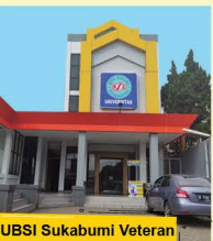
UBSI Sukabumi Veteran